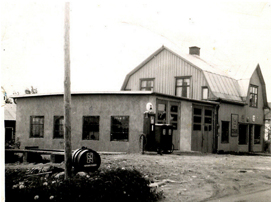
Walters bensinstation så som den såg ut 1950

1975 lämnade Valter över verksamheten till sönerna; Magnus och Bengt. De höll på fram till 1990 då verksamheten upphörde och fastigheten såldes.